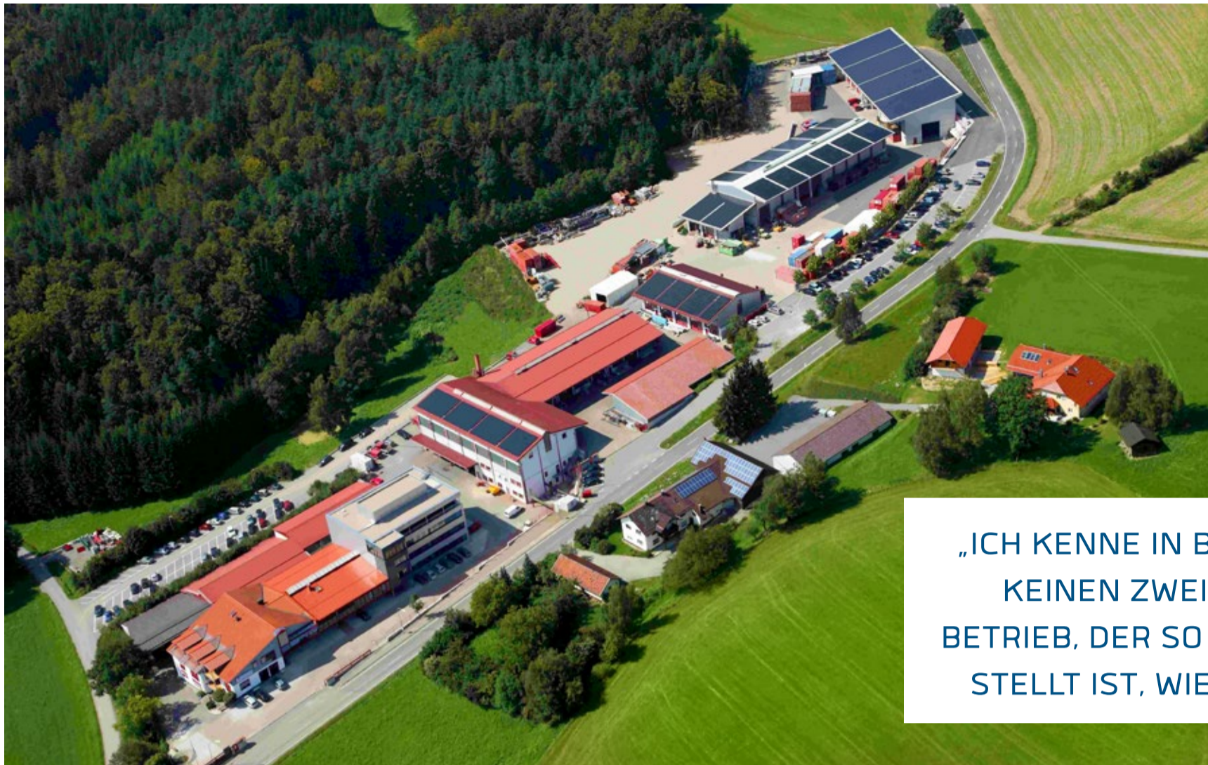
Die Lausser Unternehmenszentrale in Pilgramsberg, Rattiszell

„ICH KENNE IN BAYERN KEINEN ZWEITEN BETRIEB, DER SO AUFGESTELLT IST, WIE WIR.“