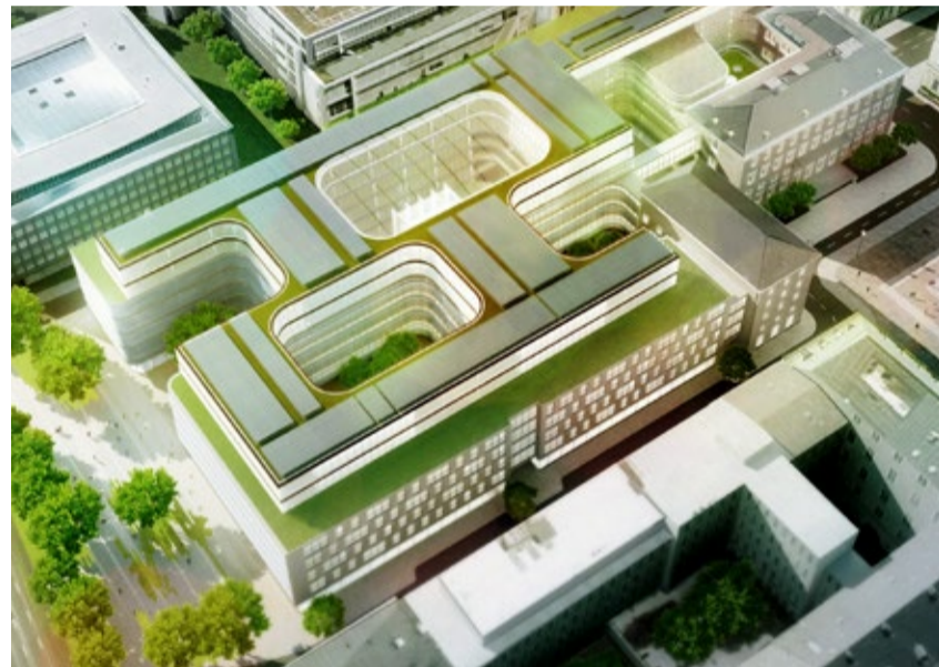
Die neue Konzernzentrale am Wittelsbacherplatz in der Draufsicht. Das historische Palais Ludwig Ferdinand und sein Nachbargebäude wurden nahtlos in den Neubau integriert.