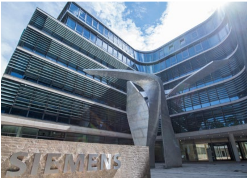
Mit 45.000 Quadratmetern oberirdischer Geschossfläche bietet die neue Zentrale viel Raum für 1.200 Mitarbeiter und zahlreiche Besucher.