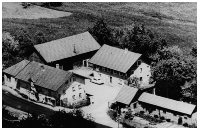
Betriebsstätte in Eggerszell ab Firmengründung 1972.