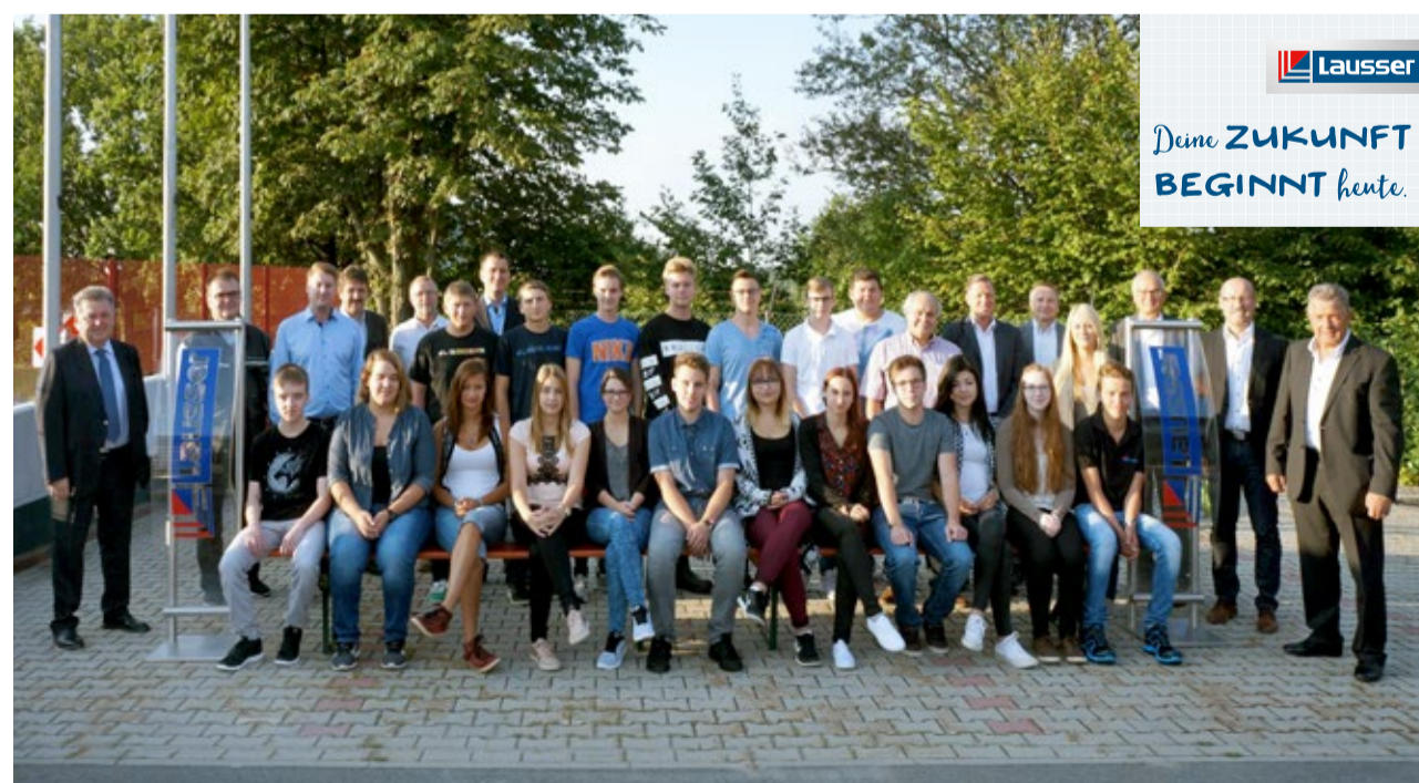
Unsere neuen Auszubildenden 2016 mit den Ausbildungsverantwortlichen

Der Bewerbertag kam sehr gut an. Deshalb ist schon der nächste für April 2017 auf unserer Agenda. Der genaue Termin wird in der Tagespresse und auf Facebook noch rechtzeitig bekannt gegeben.