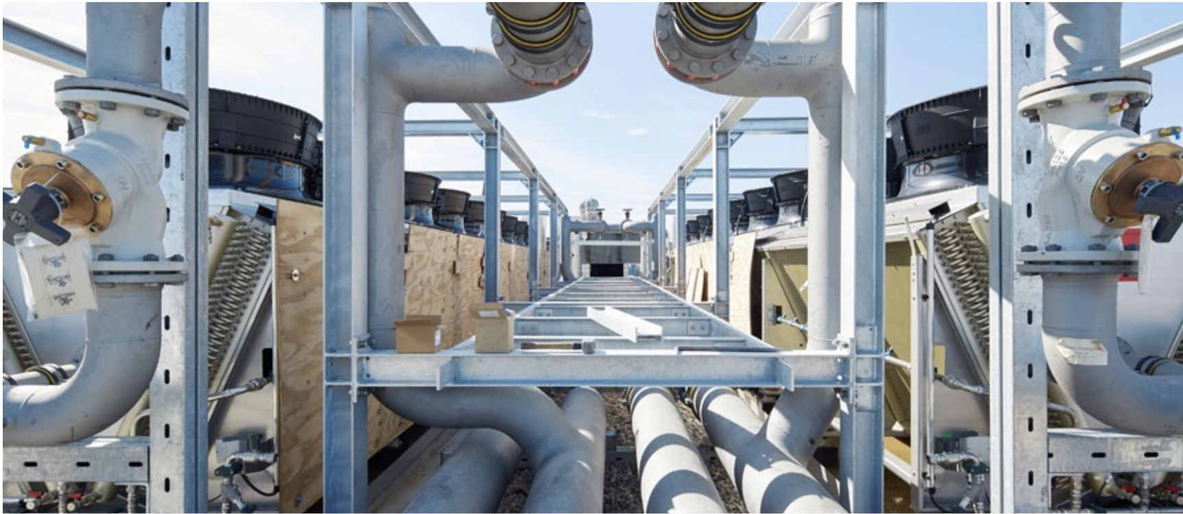
TGA-Konstruktionen auf dem Dach